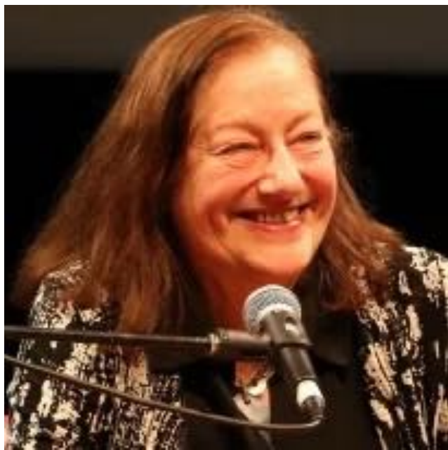
DANIÈLE LINHART, SOCIOLOGUE SPÉCIALISTE DU TRAVAIL, DIRECTRICE ÉMÉRITE DE RECHERCHE AU CENTRE NATIONAL DE LA RECHERCHE SCIENTIFIQUE (CNRS).

Les chiffres sont glaçants : près de 4 salariés français sur 10 déclarent que leur santé ou leur sécurité est menacée à cause de leur travail. L'Hexagone est le pays le plus touché par les dépressions liées au travail en Europe . Et au fil des années, l'autonomie au travail a décliné pour toutes les catégories socioprofessionnelles.