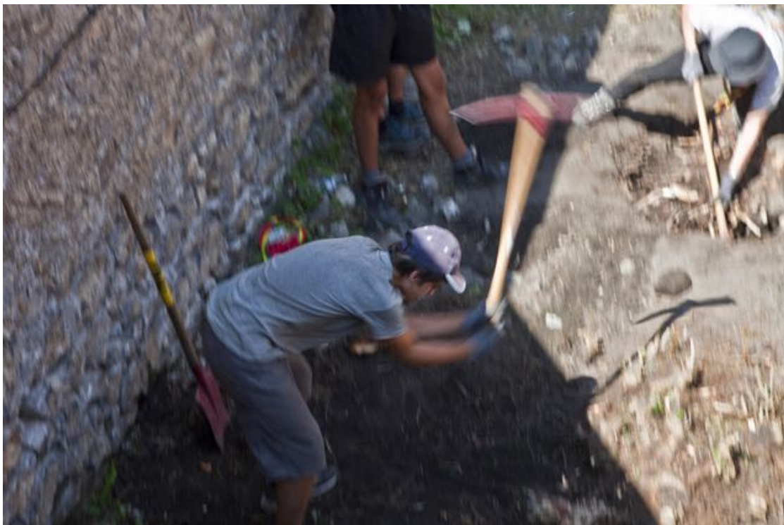
UN JEUNE SUR UN CHANTIER À BRIANÇON, EN AOÛT 2021.

Mais sans rien lâcher sur la présence de personnes de moins de 18 ans en entreprise : « Chaque mort est inadmissible mais c'est une bonne chose que les jeunes aillent dans les entreprises », a-t-il plaidé, évoquant « une question d'orientation » et de « taux d'emploi des jeunes ».