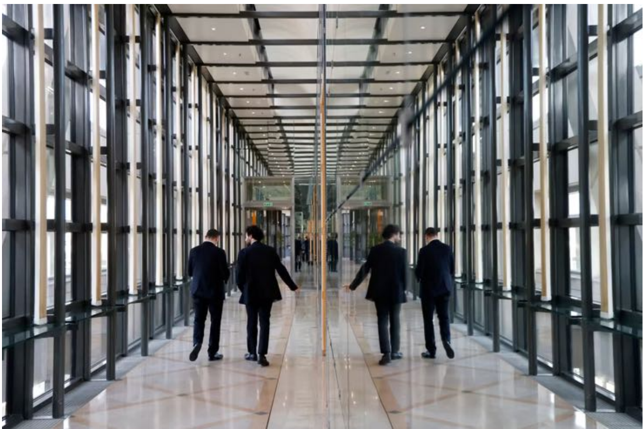
DANS UN COULOIR DU MINISTÈRE DE L'ÉCONOMIE ET DES FINANCES, À PARIS, LE 9 JANVIER 2025.